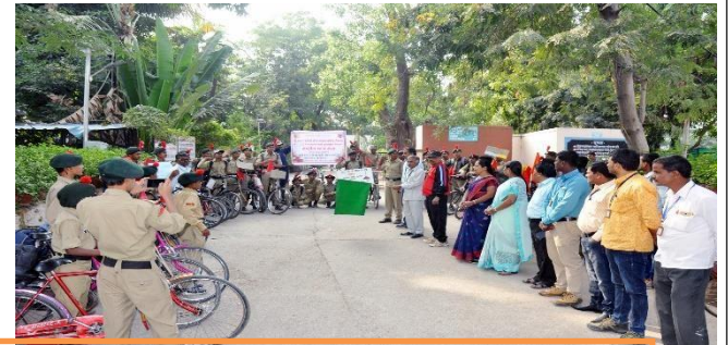
Participation of NCC Cadets in Cycle Rally for Environment Awareness