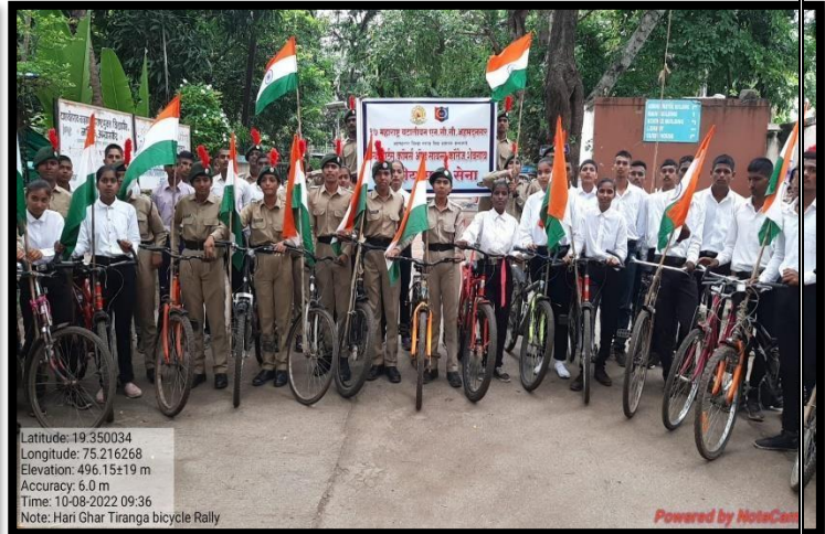
Participation of Cadets in Cycle Rally