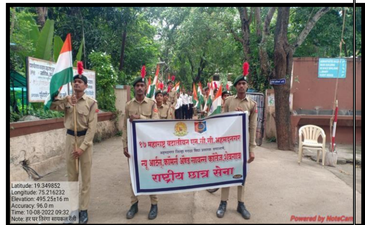
Participation of Cadets in Har Ghar Tiranga Rally