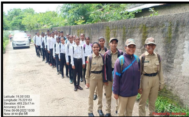
Participation of Cadets in Har Ghar Tiranga Rally