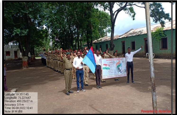
Participation of Cadets in Har Ghar Tiranga Campaign