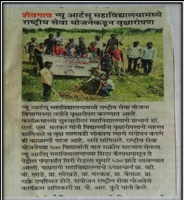
News Published in Daily Newspaper