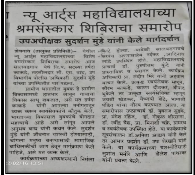
News Published in the Newspaper