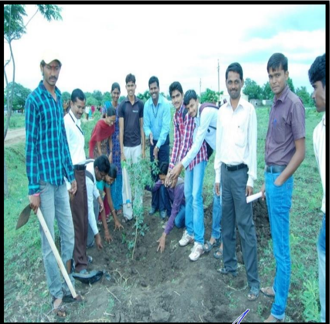
NSS Volunteer planting a tree

PRINCIPAL New Arts Commerce & Science College Shevgaon, Dist. Ahmednagar