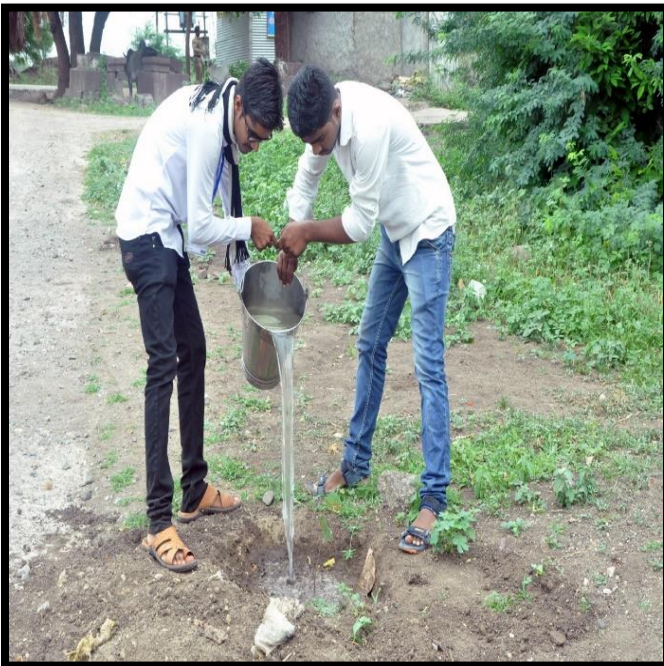
NSS Volunteer planting a tree

Programme Officer National Service Scheme New Arts Commerce & Science College Tal. Shevgaon, Dist. Ahmednagar