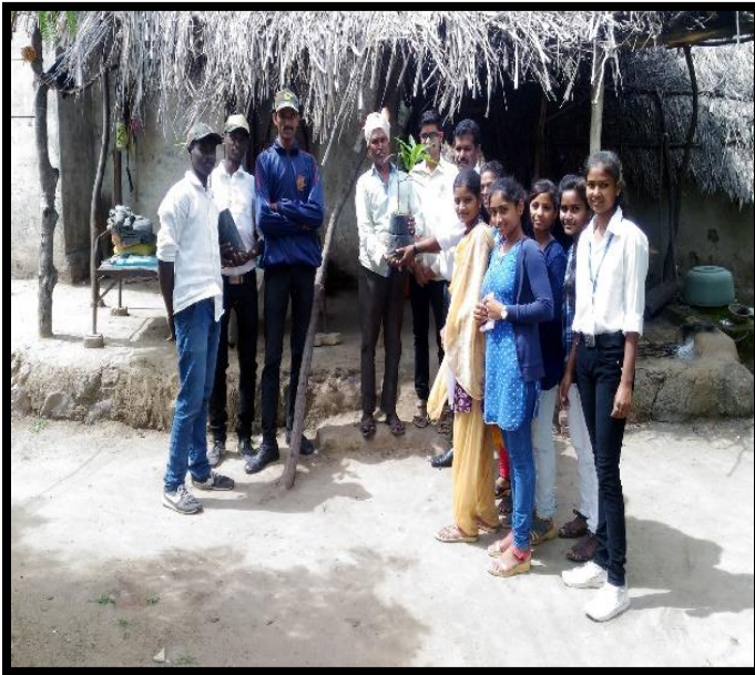
NSS Volunteers Planting tree