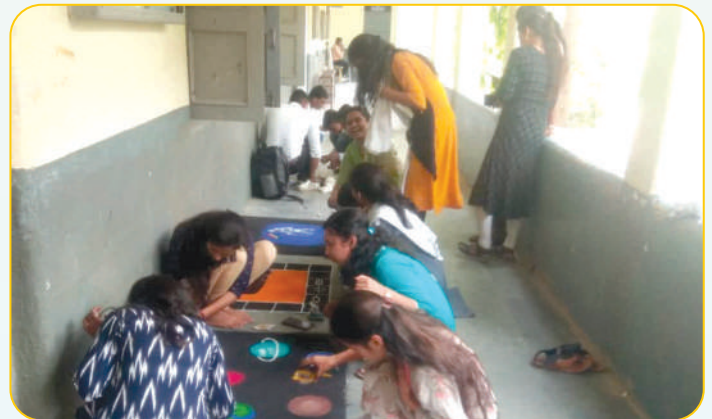
वैज्ञानिक संकल्पनेतील (सायंटीफिक) रांगोळी स्पर्धेत सहभागी स्पर्धक रांगोळी रेखाटतांना