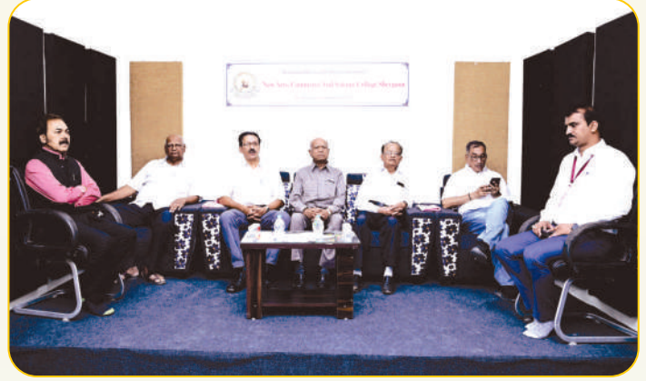
ऑडिओ - व्हिज्युअल स्टुडिओच्या उद्घाटनानंतर त्यासंबंधीची माहिती घेताना सन्माननीय संस्था पदाधिकारी