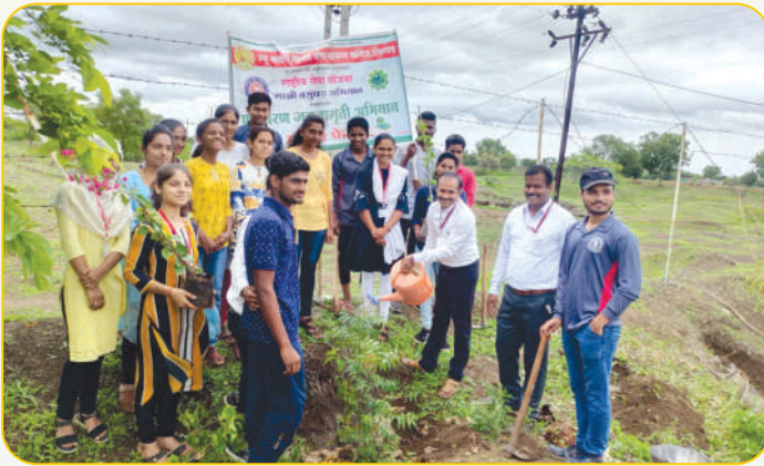
राष्ट्रीय सेवा योजनेच्या सालवडगाव येथील विशेष श्रमसंस्कार शिबीरात वृक्षारोपण करताना प्राध्यापक व रा.से.यो. स्वयंसेवक