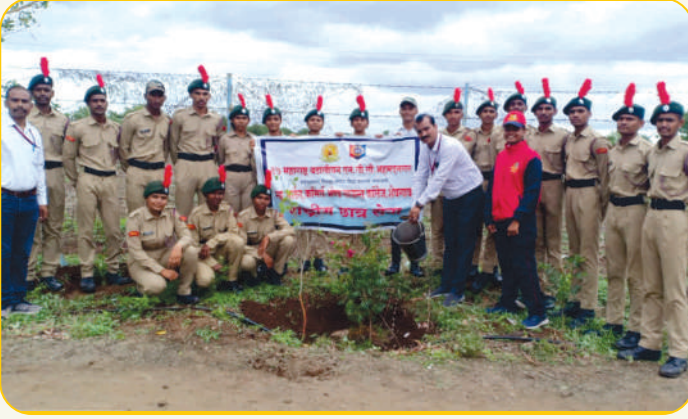
CIDA कॅम्पस मध्ये वृक्षारोपण करताना राष्ट्रीय छात्र सेनेचे छात्रसैनिक व प्राचार्य