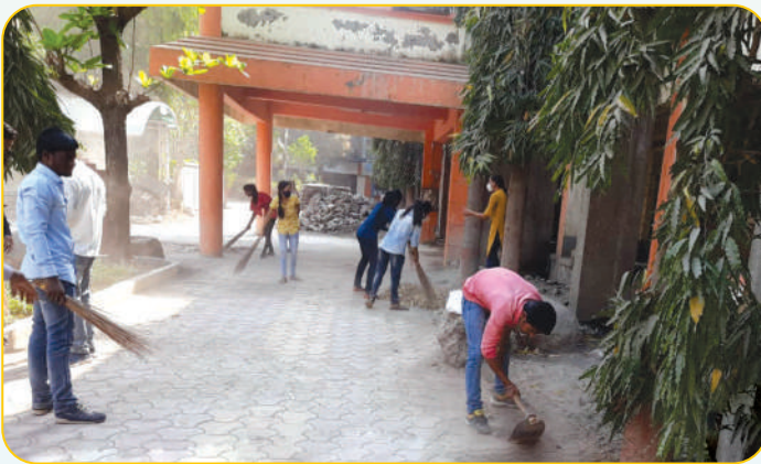
महाविद्यालयाच्या परिसरात स्वच्छता करताना राष्ट्रीय सेवा योजनेचे स्वयंसेवक