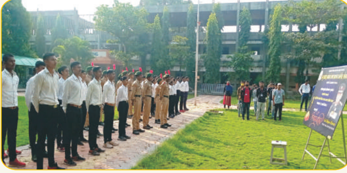
भारताचे चीफ ऑफ डिफेन्स जनरल बिपीन रावत यांचे अपघाती निधन झाले. राष्ट्रीय छात्र सेनेच्या वतीने त्यांना आदरांजली वाहताना कॅडेट्स