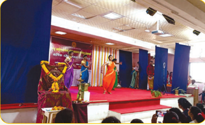
वार्षिक स्नेहसंमेलनात 'लावणी नृत्य' सादर करताना विद्यार्थिनी