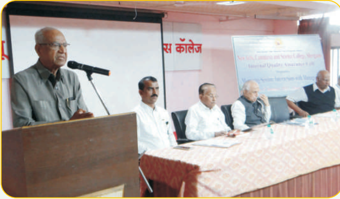
‘महाविद्यालय विकास समिती’ बैठकीच्या निमित्ताने मार्गदर्शन करताना संस्थेचे उपाध्यक्ष मा.श्री.रा.ह.दरे साहेब व उपस्थित मान्यवर