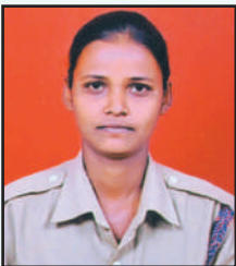
कणगरे दिपाली दादासाहेब बेस्ट पायलटिंग