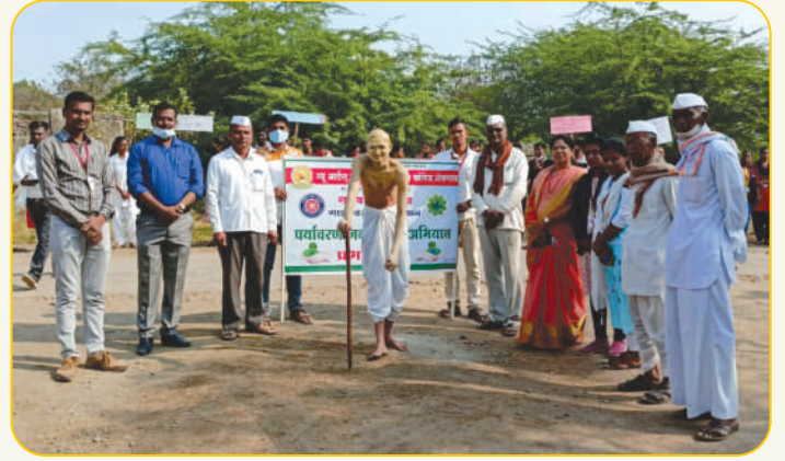
राष्ट्रीय सेवा योजनेच्या सालवडगाव येथील विशेष श्रमसंस्कार शिबीरात पर्यावरण जन-जागृती रॅलीमध्ये पथनाट्य सादर करताना स्वयंसेवक