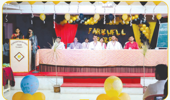
‘संगणकशास्त्र’ शाखेच्या तृतीय वर्षाच्या विद्यार्थ्यांच्या निरोप समारंभ प्रसंगी मा.प्राचार्य व प्राध्यापक