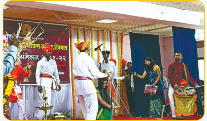
वार्षिक स्नेहसंमेलनात महाविद्यालयाचे विद्यार्थी पारंपरिक 'जागरण - गोधळ' सादर करताना