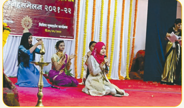
वार्षिक स्नेहसंमेलनात 'कव्वाली' सादर करतानाचा एक क्षण