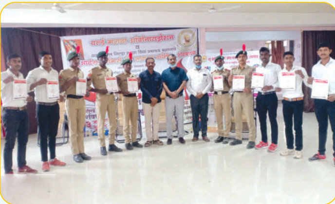
रक्तदान शिबिरामध्ये उत्स्फूर्तपणे रक्तदान केलेले रक्तदाते