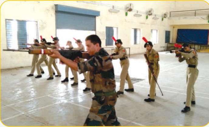
पी.आय. स्टाफ कडून एन.सी.सी. छात्रसैनिकांना फायरिंगचे ट्रेनिंग देतानाचा एक क्षण