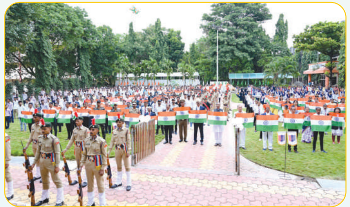
'आजादी का अमृतमहोत्सव' कार्यक्रमांतर्गत 'हर घर तिरंगा' उपक्रमात सहभागी छात्रसैनिक विद्यार्थी, प्राचार्य, शिक्षक व शिक्षकेत्तर कर्मचारी वृंद