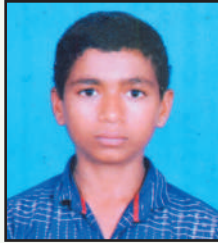
जमधडे सौरभ बाबासाहेब हॉर्टिकल्चर १२ वी (२०२२) द्वितीय