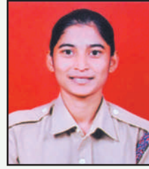
गतकळ प्रमोदिनी शिवाजी सार्जंट