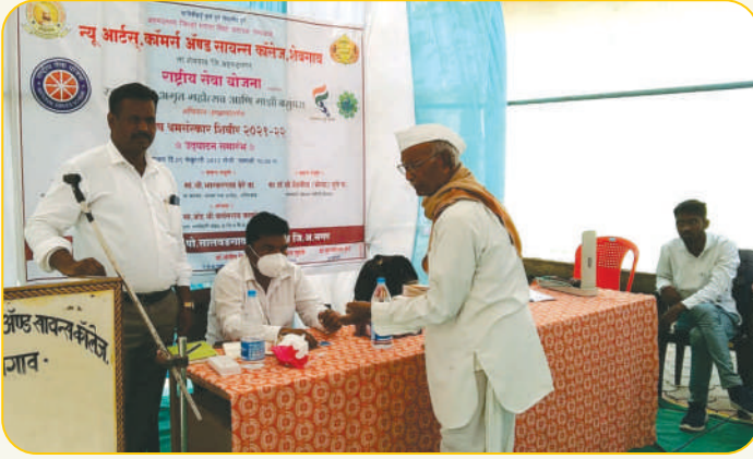
राष्ट्रीय सेवा योजनेच्या सालवडगाव येथील विशेष श्रमसंस्कार शिबीरात ग्रामस्थांची आरोग्य तपासणी करतानाचा एक क्षण