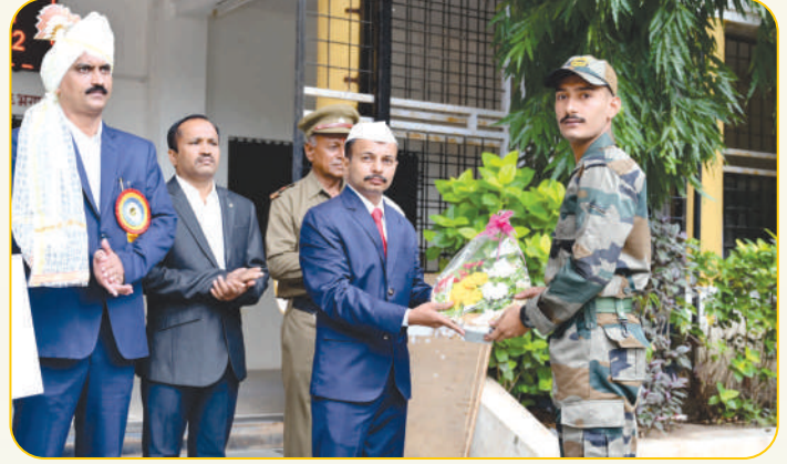
‘आजादी का अमृतमहोत्सव’ निमित्त सैनिकांचा सत्कार