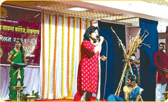
वार्षिक स्नेहसंमेलन प्रसंगी 'भूपाळी' सादर करताना विद्यार्थिनी