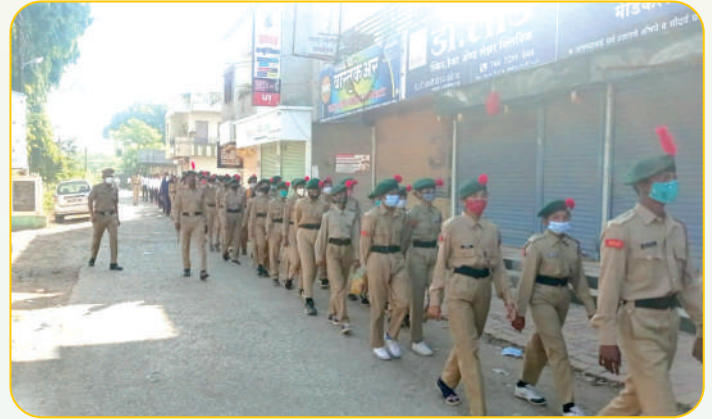
छात्र सेना दिवस निमित्ताने छात्र सैनिकांची शेवगाव शहरात रॅली