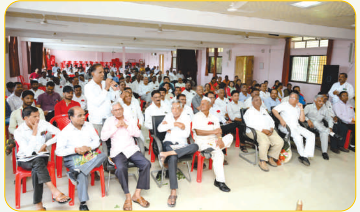
महाविद्यालयातर्फे आयोजित माजी विद्यार्थी मेळाव्यात सहभागी झालेले माजी विद्यार्थी