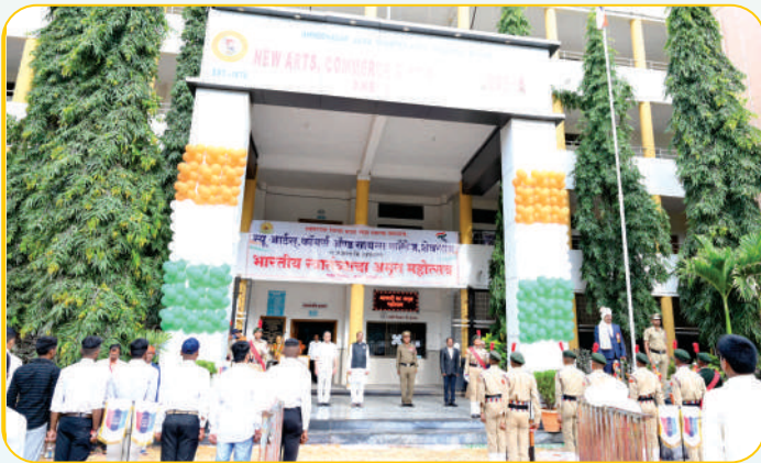
'आजादी का अमृतमहोत्सव' ध्वजारोहण प्रसंगी प्राचार्य व उपस्थित मान्यवर