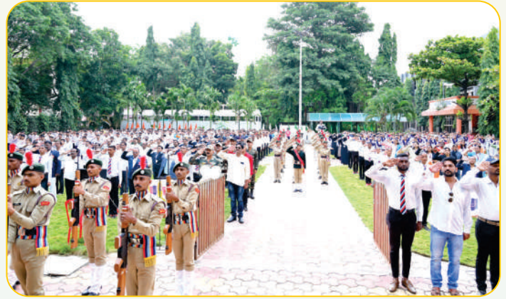
'आजादी का अमृतमहोत्सव' प्रसंगी ध्वजास मानवंदना देताना विद्यार्थी व प्राध्यापक वृंद