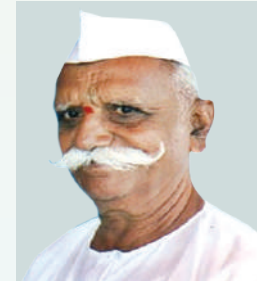
मा.श्री. सीताराम वि.खिलारी विश्वस्त