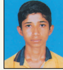
गोबरे पृथ्वीराज एकनाथ हॉर्टिकल्चर १२ वी (२०२१) द्वितीय