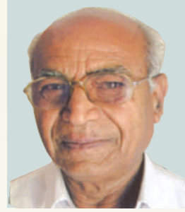
मा.श्री. रामचंद्र हरिभाऊ दरे उपाध्यक्ष