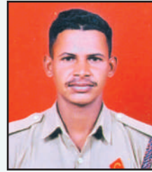
लॉंढे दिनेश गोपीचंद एल.एल.सी.पी.एल.