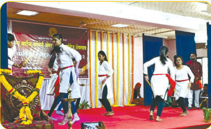
वार्षिक स्नेहसंमेलनात 'समुह नृत्य' सादर होत असतानाचा एक नयनरम्य क्षण